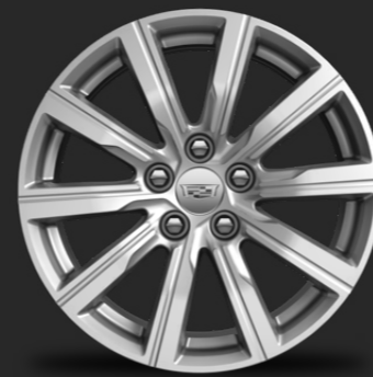
RINES DE ALUMINIO DE 18"