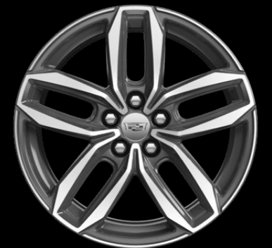
RINES DE ALUMINIO DE 20"